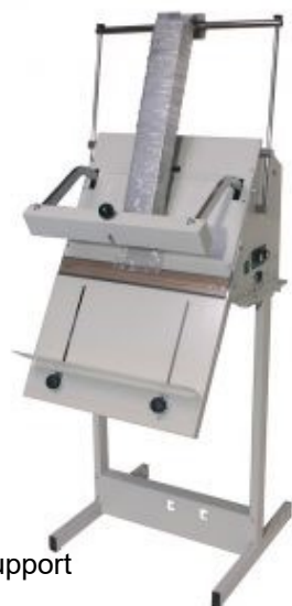
Pandyno avec Piètement support